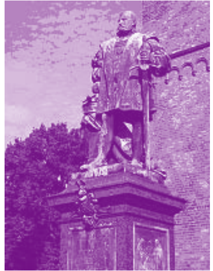
Standbild Joachims II. in Berlin-Spandau

In diesem Sinne hielt die Reformation Einzug in Brandenburg. Die Bevölkerung wurde lutherisch, der Kurfürst zog nach. Die „Ceremonien“ änderten sich kaum, aber die Pfarrer konnten heiraten, die Wandlung wurde abgeschafft, auch das Volk bekam den Kelch beim Abendmahl gereicht, die Messe war deutschsprachig und die Predigt evangelisch geworden. Aber Joachim II. wollte sicher gehen. So ließ er sich von Kaiser Karl. V. seine Kirchenordnung von 1540 bestätigen. Derartig gesichert, nahm er nach und nach Kirchenvisitationen vor, um die Kirche auf den Landesherrn auszurichten und eine Territorialkirche zu schaffen. So begründete er eine kirchliche Verwaltung 1543 mit der Gründung des „Cöllnischen Consistoriums“. Der Kurfürst als Landesherr wurde jetzt oberster Kirchenherr „Summus Episcopus“. Als solcher entschied er auch über die Besetzung des Consistoriums.